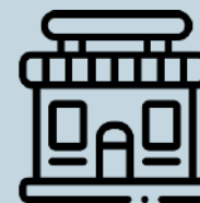
Centros comerciales y otros centros de ocio

Apto para su implementación en cualquier establecimiento del mundo que desee acogerse a una certificación oficial de normativa europea.