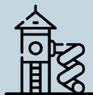
Parques acuáticos y/o temáticos